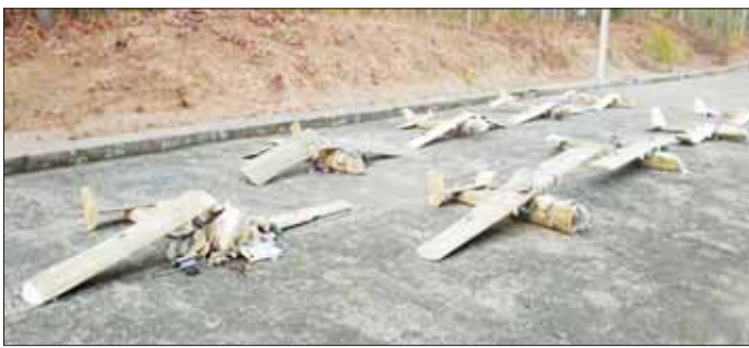
အကြမ်းဖက်သမားများလွှတ်တင်ခဲ့သည့် fixed Wing များအား ပစ်ချဟုတ်တားနိုင်ခဲ့ပြီး သိမ်းဆည်းရမိမှုအား တွေ့မြင်ရစဉ်။

နေပြည်တော် ဧပြီ ၄ နေပြည်တော်ကောင်စီနယ်မြေ၊ ဇေယျာသီရိမြို့နယ်နှင့် အေလာမြို့နယ်တို့ရှိ အရေးကြီးအဆောက်အအုံများနှင့် နေရာဌာနများအား ဖောက်ခွဲဖျက်ဆီးရန်နှင့် ပြည်သူများ အထိတ်တလန့်ဖြစ်စေရန် ယုတ်မာကောက်ကျစ်သည့်အကြံအစည်များဖြင့် အကြမ်းဖက်သမားများသည် ယနေ့နံနက် ၁၀ နာရီခွဲခန့်တွင် အေလာမြို့နယ်နှင့် ဇေယျာသီရိမြို့နယ်အနီးတို့မှ Fixed Wing များ လွှတ်တင်ခဲ့ပြီး အကြမ်းဖက်ဖောက်ခွဲရေး လုပ်ရပ်များ လုပ်ဆောင်နိုင်ရန် ကြံစည်ကြပြီးပစ်ခတ်ခဲ့သည်။ ထိုသို့ ကြံစည်ကြပြီးပစ်ခတ်မှုအား နေပြည်တော်ကောင်စီနယ်မြေအတွင်း လေကြောင်း လုံခြုံရေးတာဝန်များထမ်းဆောင်လျက်ရှိသည့် လေကြောင်းရန်