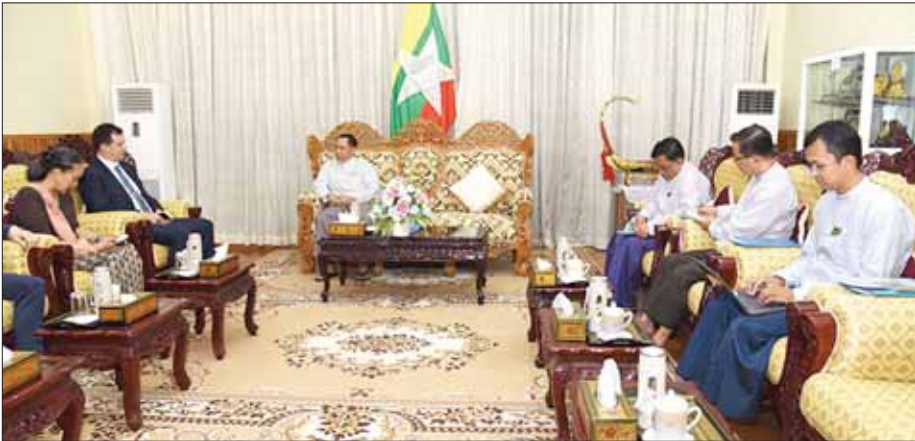
ကျော်ဇေယျ၊ မြန်မာနိုင်ငံအတွင်း ဘေးအန္တရာယ်ကင်းရှင်းရေးနှင့် လုံခြုံရေးဌာနမှ Mr. Marcoluigi Corsi၊ မြန်မာနိုင်ငံဆိုင်ရာ ကုလသမဂ္ဂ ဘေးအန္တရာယ်ကင်းရှင်းရေးနှင့် လုံခြုံရေးဌာနမှ Mr. Marco Smoliner တို့ တက်ရောက်ခဲ့ကြကြောင်း သိရသည်။ သတင်းစဉ်

နေပြည်တော် ဧပြီ ၄ နိုင်ငံတော်စီမံအုပ်ချုပ်ရေးကောင်စီ အဖွဲ့ဝင်၊ ပြည်ထောင်စုဝန်ကြီးဌာန ပြည်ထောင်စုဝန်ကြီး ဒုတိယဗိုလ်ချုပ်ကြီး ရာပြည့်သည် ကုလသမဂ္ဂဘေးအန္တရာယ်ကင်းရှင်းရေးနှင့်လုံခြုံရေးဌာန(United Nations Department of Safety and Security-UNDSS) ၏ အကြီးအကဲ Under-Secretary-General Mr. Gilles Michaud ဦးဆောင်သည့် ကိုယ်စားလှယ်အဖွဲ့ကို ယနေ့နံနက် ၁၀ နာရီတွင် နေပြည်တော်ရှိ ရုံးအမှတ်(၁၀) ပြည်ထောင်စုဝန်ကြီးဌာန ပြည်ထောင်စုဝန်ကြီး၏ ဧည့်ခန်းမ၌ လက်ခံတွေ့ဆုံသည်။ (ယာဝု) တွေ့ဆုံစဉ် မြန်မာနိုင်ငံအတွင်း တာဝန်ထမ်းဆောင်လျက် ရှိသော ကုလသမဂ္ဂဝန်ထမ်းများ၏ ဘေးကင်းလုံခြုံရေးဆိုင်ရာ ကိစ္စရပ်များ၊ ကုလသမဂ္ဂဝန်ထမ်းများ ခရီးသွားလာခွင့်နှင့် စစ်လျဉ်းသည့် ကိစ္စရပ်များ၊ မြန်မာနိုင်ငံအတွက် လူသားချင်းစာနာထောက်ထားမှုဆိုင်ရာ အကူအညီပေးရေးဆိုင်ရာ ကိစ္စရပ်များ၊ ပြည်ထောင်စုဝန်ကြီးဌာနနှင့် ကုလသမဂ္ဂဘေးအန္တရာယ်ကင်းရှင်းရေးနှင့် လုံခြုံရေးဌာနတို့အကြား ပူးပေါင်း ဆောင်ရွက်ရေးဆိုင်ရာ ကိစ္စရပ်များကို ရင်းနှီးပွင့်လင်းစွာ ဆွေးနွေးခဲ့ကြသည်။ တွေ့ဆုံပွဲသို့ ပြည်ထောင်စုဝန်ကြီးဌာန အမြဲတမ်းအတွင်းဝန် ဦးခိုင်ထွန်းဦး၊ မြန်မာနိုင်ငံရဲတပ်ဖွဲ့ နိုင်ငံပြုတ်ကျော် မှုခင်းဌာနကြီး၊ ဌာနကြီးမှူး ယာယီရုံးမှူးချုပ်