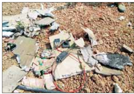
ဖောက်ခွဲဖျက်ဆီးရေးပစ္စည်းများပါရှိသည့် fixed Wing များအား ဖောက်ခွဲဖျက်ဆီးထားရှိမှုအား တွေ့မြင်ရစဉ်။

ကာကွယ်ရေး တပ်ဖွဲ့များက လေကြောင်းရန်ကာကွယ်ရေးစနစ်များဖြင့် ထောက်လှမ်းသိရှိခဲ့ရပြီး အဆိုပါ Fixed Wing များ အားလုံးကို လက်ဦးမှရယူ ဟုတ်တားနိုင်ခဲ့သည်။ ထိုသို့ လက်ဦးမှရယူ ဟုတ်တားနိုင်ခဲ့မှုကြောင့် နှစ်စင်းမှာ သတ်မှတ်နေရာမရောက်မီ လေထဲတွင် ပေါက်ကွဲပျက်စီးခဲ့ပြီး အခြား Fixed Wing အားလုံး ကိုလည်း ပစ်ချဟုတ်တားနိုင်ခဲ့သည်။ အဆိုပါ ပစ်ချဟုတ်တားခဲ့မှုကြောင့် မြေပြင်ပေါ်သို့ ပျက်ကျခဲ့ရသည့် Fixed Wing များအနက် ၁၃ စင်းအား