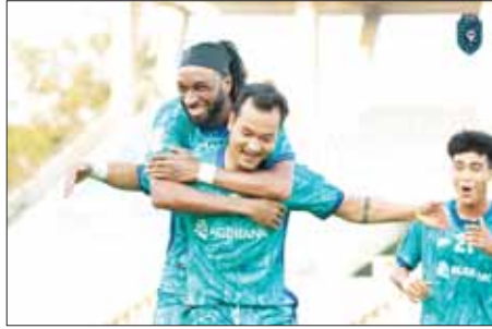
အုပ်စု (က) တွင် ဦးဆောင်နေသည့် ရန်ကုန်ယူနိုက်တက်အသင်း။

၂၀၂၄ ခုနှစ်၊ ဧပြီ ၄ ရက်နေ့အထိ လူစီးအမြန်ရထားအချို့ ပြေးဆွဲမှု ခေတ္တရပ်နားထားမည်ဖြစ်ပါသည်။ ပို့ဆောင်ရေးနှင့်ဆက်သွယ်ရေးဝန်ကြီးဌာန၊ မြန်မာ့မီးရထားသည် မဟာသင်္ကြန်ကာလ (၁၃.၄.၂၀၂၄) ရက်နေ့မှ (၂၁.၄.၂၀၂၄)ရက်နေ့အတွင်း ခရီးသွားပြည်သူများနှင့် ဌာနဆိုင်ရာ ဝန်ထမ်းများ အဆင်ပြေစွာ ခရီးသွားလာနိုင်ရန်အတွက် ဧပြီလ ၁၃ ရက်နေ့နှင့် ဧပြီလ ၂၂ ရက်နေ့တို့တွင် အထူးရထားများကို ထပ်တိုးပြေးဆွဲပေးမည်ဖြစ်ပြီး သင်္ကြန်အကြိုနေ့ ဖြစ်သည့် ဧပြီလ ၁၃ ရက်နေ့မှ သင်္ကြန်အတက်နေ့ ဖြစ်သည့် ၁၆ ရက်နေ့အထိ လူစီးအမြန်ရထားအချို့ ပြေးဆွဲမှု ခေတ္တရပ်နားထားမည်ဖြစ်ပါသည်။ လက်ရှိပြေးဆွဲပေးနေသော ရန်ကုန်-မန္တလေးလမ်းပိုင်းအတွင်း အမှတ်(၁၁)အဆန်၊ အမှတ်(၁၂)အစုန်ရထားနှင့် ရန်ကုန်-မော်လမြိုင်လမ်းပိုင်းအတွင်း အမှတ်(၈၁)အဆန်၊ အမှတ်(၈၂)အစုန်ရထားများကို ပုံမှန်အတိုင်း ပြေးဆွဲပေးသွားမည်ဖြစ်ပြီး ရန်ကုန်-မန္တလေး-ရန်ကုန်၊ စာမျက်နှာ ၉ ကော်လံ ၁ ❖