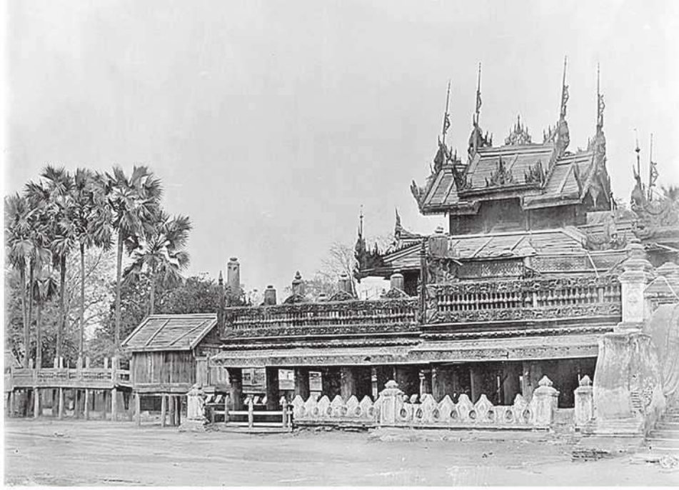
အမည်မသိဓာတ်ပုံဆရာရိုက်ကူးခဲ့သည့် မဟာဝေယန်ဘုံကျော်(မိုးကောင်း)ကျောင်း

မြန်မာမှုပညာသုတေသနကလေးရာ ဘုန်းကြီးကျောင်း အများစုကို ကုန်းဘောင်ခေတ်နှောင်းပိုင်း ရတနာပုံ ခေတ်တွင် ကျွန်းသစ်ဖြင့် အများဆုံးတည်ဆောက် ခဲ့သည်။ သို့သော် ရတနာပုံခေတ်မတိုင်မီ အမရပူရခေတ်တွင်လည်း တော်ဝင်မိသားစုများတည် ဆောက်လှူဒါန်းခဲ့သည့် သစ်သားဘုန်းကြီးကျောင်း များလည်းရှိခဲ့သည်။