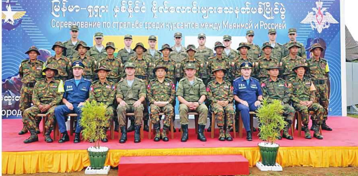
မြန်မာ-ရုရှား နှစ်နိုင်ငံ ဗိုလ်လောင်းများ သေနတ်ပစ်ပြိုင်ပွဲတွင် စုပေါင်းမှတ်တမ်းတင်ဓာတ်ပုံရိုက်စဉ်။

နေပြည်တော် ၇ ဇူလိုင် ၉ မြန်မာနိုင်ငံက အိမ်ရှင်အဖြစ် ကျင်းပသည့် မြန်မာ-ရုရှား နှစ်နိုင်ငံ ဗိုလ်လောင်းများ သေနတ်ပစ်ပြိုင်ပွဲကို ဗထူးတပ်မြို့ တပ်မတော်(ကြည်း) ဗိုလ်သင်တန်းကျောင်း (ဗထူး)ရှိ မိတာ ၆၀၀ အာဆီယံစက်ပစ်ကွင်း၌ ဇူလိုင် ၇ ရက်မှ ၉ ရက်ထိ ကျင်းပခဲ့ရာ