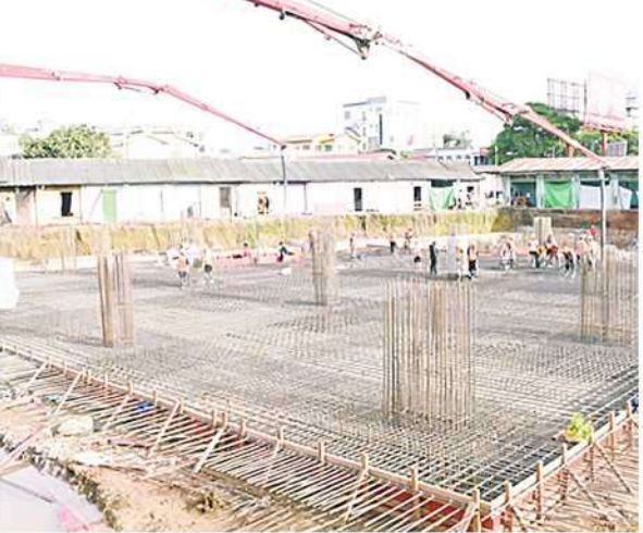
ကာလအတွင်း ပြီးစီးရေး၊ အရည်အသွေး သတ်မှတ်စံချိန်စံနှုန်းနှင့်အညီ ဖြစ်စေရေး ကြပ်မတ်ဆောင်ရွက်သွားရန် မှာကြားပြီး လုပ်ငန်းခွင်အတွင်း လှည့်လည်ကြည့်ရှုကာ လိုအပ်သည်များကို ဖြည့်ဆည်းဆောင်ရွက်ပေးခဲ့ကြောင်း သတင်းရရှိသည်။ မျိုးကျော်