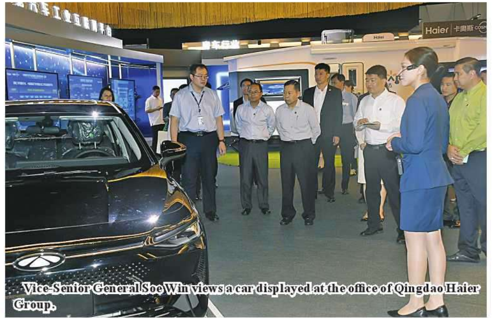
Vice-Senior General Soe Win views a car displayed at the office of Qingdao Haier Group.