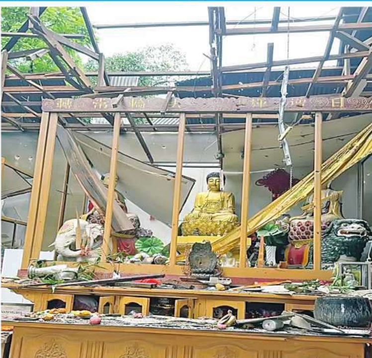
MNDA အကြမ်းဖက်သောင်းကျန်းသူများက လားရှိုးမြို့အတွင်းသို့ ရှေ့တိုက်ခိုး များ၊ Drop Bomb များဖြင့် ပစ်ခတ်တိုက်ခိုက်မှုကြောင့် တရုတ်ဖာရူန့်ဘုံကျောင်း ထိခိုက်ပျက်စီးခဲ့မှု မှတ်တမ်းဓာတ်ပုံ။

သူများ၊ လိမ်လည်ခံရသူအများစုဟာလည်း တရုတ်နိုင်ငံသားများသာဖြစ်လို့ မြန်မာ နိုင်ငံက အများစုက သိရှိခဲ့ခြင်းမရှိပါဘူး။ မြန်မာနိုင်ငံအစိုးရအနေနဲ့ ဒီကျားဖြန့်ကိစ္စ ကို သိရှိတာနဲ့တစ်ပြိုင်တည်း တရုတ်နိုင်ငံ နဲ့တက်ကြွစွာ ပူးပေါင်းဆောင်ရွက်ပြီး နှိမ်နင်းခဲ့ပါတယ်။ ကိုးကန့်ဒေသမှာသာမက အခြားနယ်စပ်ဒေသများမှာလည်း ဆောင် ရွက်ခဲ့ပါတယ်။ မနေ့ကထိ မိုင်းပေါက်ဒေသ၊ လောက်ကိုင်ဒေသ၊ တာချီလိတ်ဒေသ၊ မူဆယ်ဒေသ၊ မြဝတီ(ရွှေတူတ္တိုက်၊ KK Park) တို့ကနေ ဖော်ထုတ်ဖမ်းဆီးရမိခဲ့တဲ့ တရုတ်နိုင်ငံသား ၅၁၈၅၁ ဦး၊ ဝီယက်နမ် နိုင်ငံသား ၁၁၄၃ ဦး၊ ထိုင်းနိုင်ငံသားဦးရေ ၆၄၀ အပါအဝင်ဦးရေ ၅၁၅၀၇ ကို သက်ဆိုင်ရာ နိုင်ငံတွေကို လွှဲပြောင်းပေးနိုင်ခဲ့ပါတယ်။ နောက်ပိုင်းမှာ MNDA ဟာ ကိုးကန့် နယ်မြေ အထူးဒေသ(၁)ရရှိရေးဆိုပြီး လုပ်ဆောင်လာပါတယ်။ အကြမ်းဖက် NUG အဖွဲ့နဲ့တွေ့ဆုံပြီး သူတို့နယ်မြေကို လိုက်ပြတာတွေ၊ ဆွေးနွေးတာတွေလုပ်လာ တဲ့အပြင် ကိုးကန့်ဒေသရဲ့ ပြင်ပကိုပါ ဆက်လက်နယ်မြေချဲ့ထွင် တိုက်ခိုက်လာ တာတွေ့ရပါတယ်။ NUG အဖွဲ့ရဲ့ အသံ ကိုလိုက်ပြီး ပြောကြားနေတာကိုလည်း တွေ့ရပါတယ်။ ကိုးကန့်နယ်မြေထဲက ကလေးငယ်များပါမကျန် လူသစ်စုဆောင်း တာတွေ၊ ကိုးကန့်ဒေသအတွင်းမှာ အလုပ် လုပ်ကိုင်ခဲ့ကြတဲ့ ဗမာအပါအဝင် တိုင်းရင်း သားအလုပ်သမားတွေကို ဖမ်းဆီးပြီး MNDA ထဲကိုသွင်းပြီး တိုက်ပွဲဝင်ခိုင်း တာတွေလုပ်ဆောင်ခဲ့ပါတယ်။ စာသင် ကျောင်းတွေကို ပိတ်ပင်တာတွေ၊ ပညာ သင်ကြားမှု ပိတ်ပင်တာတွေကိုလည်း ပြုလုပ်ခဲ့ပါတယ်။ TNLA အဖွဲ့အနေနဲ့ လည်း အလားတူလုပ်ဆောင်ခဲ့ပါတယ်။ နောက်ပိုင်းမှာ အဲဒီဒေသမှာရှိတဲ့ သူတို့ လက်နက်ကိုင်အဖွဲ့အချင်းချင်း နယ်မြေ