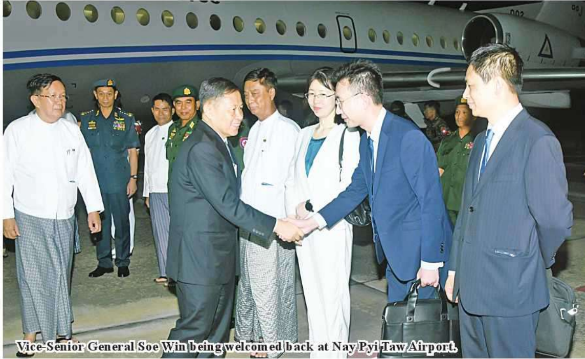
Vice-Senior General Soe Win being welcomed back at Nay Pyi Taw Airport.

Nay Pyi Taw July 9 Vice Chairman of the State Administration Council Deputy Prime Minister Vice-Senior General Soe Win, which attended the Green Development Forum of the Shanghai Cooperation Organization