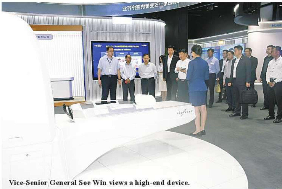
Vice-Senior General Soe Win views a high-end device.

history of the centre to the Vice-Senior General and conducted round the modern