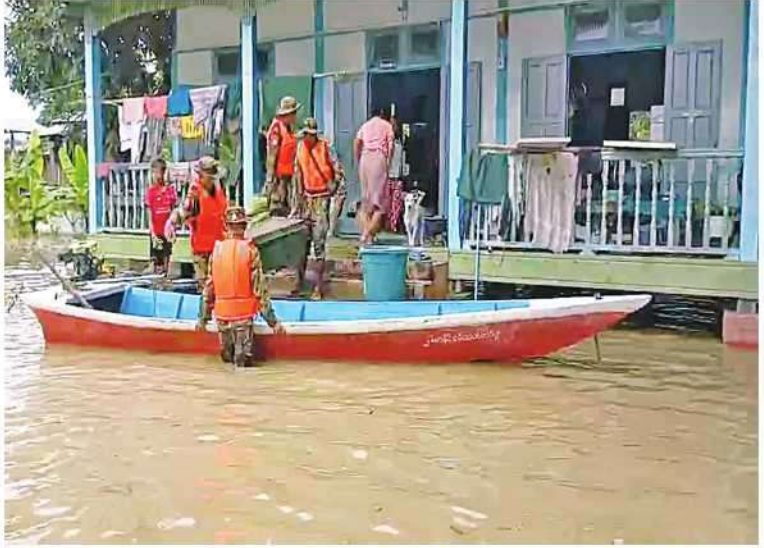
အနောက်မြောက်တိုင်းစစ်ဌာနချုပ်မှ နယ်မြေခံတပ်မတော်သားများက ရေဘေးသင့်ပြည်သူများကို ရေဘေးလွတ်ရာသို့ ကူညီရွှေ့ပြောင်းပေးစဉ်။

နေပြည်တော် ရူလိုင် ၉ မြို့နယ် ကျောက်တောင်ရပ်ကွက်၊ တံတားစစ်ကိုင်းတိုင်းဒေသကြီးအတွင်း၌ မိုးသည်းထန်စွာ ရွာသွန်းမှုကြောင့် ချင်းတွင်းမြစ်ရေမြင့်တက်ကာ ခန္တီးမြို့နယ်နှင့် မော်လိုက်မြို့နယ်တို့အတွင်းရှိ ရပ်ကွက်၊ ကျေးရွာများအတွင်းသို့ မြစ်ရေဝင်ရောက်မှုများ ဖြစ်ပေါ်လျက်ရှိပြီး ရေဘေးသင့်ပြည်သူများကို ကူညီကယ်ဆယ်ရေးလုပ်ငန်းများ ဆောင်ရွက်ပေးလျက်ရှိသည်။ ထိုသို့ဆောင်ရွက်ပေးလျက်ရှိရာ ယနေ့တွင် နယ်မြေခံတပ်မတော်သားများနှင့် ဌာနဆိုင်ရာ တာဝန်ရှိသူများက မော်လိုက်မြို့နယ် ကျောက်တောင်ရပ်ကွက်၊ အောင်မင်္ဂလာရပ်ကွက်၊ သရက်ကုန်းရပ်ကွက်၊ စွယ်တော်ရပ်ကွက်၊ညောင်ပင်သာရပ်ကွက်၊ တွန်းပင်ကျေးရွာနှင့် တိန်းသာကျေးရွာတို့ရှိ ရေဘေးသင့်ပြည်သူများကို ကယ်ဆယ်ရေးစခန်းများသို့ ကူညီရွှေ့ပြောင်းခြင်းလုပ်ငန်းများ ဆောင်ရွက်ပေးလျက်ရှိပြီး လိုအပ်သည့် ကျန်းမာရေး စောင့်ရှောက်မှုလုပ်ငန်းများ ဆောင်ရွက်ပေးကာ စားသောက်ဖွယ်ရာများ ထောက်ပံ့ပေးအပ်ခဲ့ကြောင်း သတင်းရရှိသည်။ (၅၀၁)