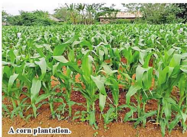
A corn plantation.

The township agriculture department conducts training courses for local farmers, field demonstrations, prevention of pests and use of