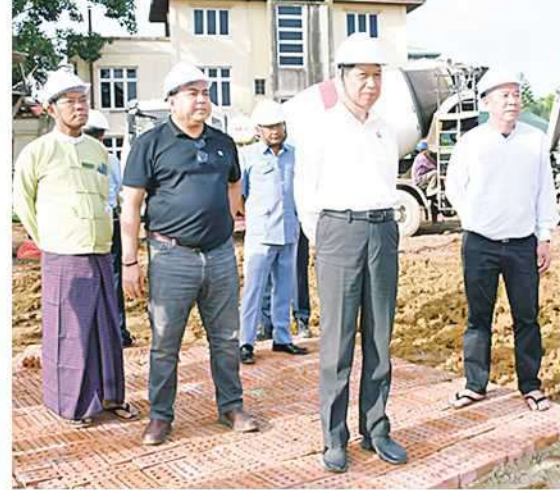
ဝန်ကြီးချုပ်က လုပ်ငန်းခွင်အန္တရာယ် တင်းရှင်းရေး အထူးဂရုစိုက်ဆောင်ရွက်ရန်၊ တည်ဆောက်ရေးလုပ်ငန်းများ သတ်မှတ်

သို့ အဝင်လမ်း နိုင်လွန်ကတ္တရာခင်းနေမှု၊ အရိပ်ရသစ်ပင်များ၊ ပန်းအလှသစ်ပင်များ စိုက်ပျိုးထားရှိမှုတို့ကို လိုက်လံကြည့်ရှု၍ လိုအပ်သည်များ ပေါင်းစပ်ညှိနှိုင်းဆောင်ရွက်ပေးသည်။ ထို့နောက် တိုင်းဒေသကြီးဝန်ကြီးချုပ်နှင့် အဖွဲ့သည် ပြင်ဦးလွင်မြို့ ရပ်ကွက်ကြီး(၂) အတွင်းရှိ သုမင်္ဂလာဈေး(ညံ့တောဈေး) ကို ခေတ်မီအဆင့်မြင့် အာရုံစီ ခြောက်ထပ်ဈေးကြီးအဖြစ် တည်ဆောက်နေသည့် လုပ်ငန်းခွင်သို့ရောက်ရှိရာ တိုင်းဒေသကြီးဝန်ကြီးချုပ်အား တာဝန်ရှိသူများက တည်ဆောက်ရေးလုပ်ငန်း စတင်ဆောင်ရွက်နေမှုများ၊ ပြီးစီးမှုနှင့် ဆက်လက်ဆောင်ရွက်မည့် လုပ်ငန်းအစီအမံများနှင့်ပတ်သက်၍ ရှင်းလင်းတင်ပြရာ တိုင်းဒေသကြီး