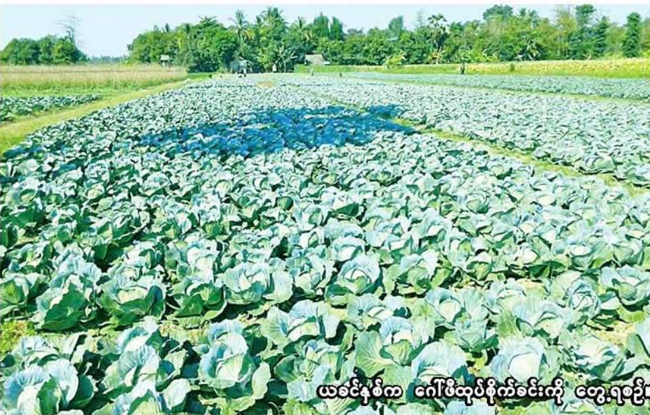
ယခင်နှစ်က ဂေါ်ဖီထုပ်စိုက်ခင်းကို တွေ့ရစဉ်