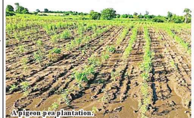
A pigeon pea plantation.