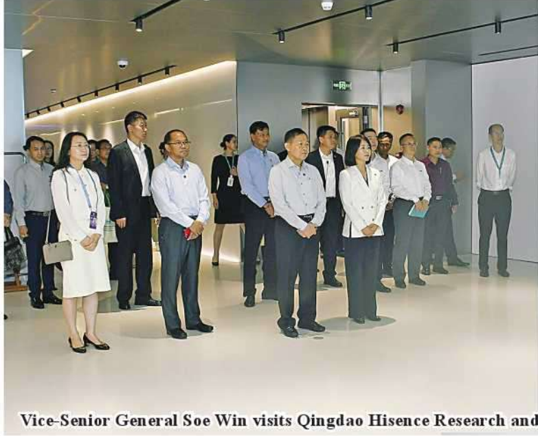
Vice-Senior General Soe Win visits Qingdao Hisense Research and Development Center.