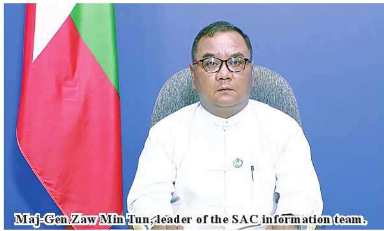
Maj-Gen Zaw Min Tun, leader of the SAC information team.

request the entire people to join hands in the seriously prioritized measures by the government to protect towns and villages and local people from terrorist attacks of MNDAA and TNLA to ensure safe and security for them. Thank you.