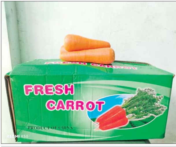
ပဲခူးတိုင်းဒေသကြီး၌ ဖမ်းဆီးရမိမှု။

ပူးပေါင်းအဖွဲ့က စစ်ဆေးမှုများ ဆောင်ရွက်ခဲ့ရာ ကျွဲတပ်ဆုံ စစ်ဆေးရေး စခန်း၌ ယာဉ်နှစ်စီးပေါ်မှ တရားဝင်စာရွက်စာတမ်းအထောက်အထား တင်ပြနိုင်ခြင်းမရှိသည့် တရုတ်နိုင်ငံထုတ် Coconut Fiber Bed Mattress အချပ် ၇၀၊ ထိုင်းနိုင်ငံထုတ် Wai Wai ခေါက်ဆွဲခြောက် ၄၁၇၆ ဘူး၊ စင်ကာပူနိုင်ငံထုတ် Beer Flavour ၃၀၀၀ ကီလိုဂရမ် အပါအဝင်ကုန်ပစ္စည်း ရှစ်မျိုး (ခန့်မှန်းတန်ဖိုးငွေကျပ် ၂၂၉၇၆၁၁၀)နှင့် အဆိုပါပစ္စည်းများ တင်ဆောင်လာသည့် Hino Profia Truck တစ်စီးနှင့် Mitsubishi Canter တစ်စီး (ခန့်မှန်းတန်ဖိုးငွေကျပ် ၅၅၀၀၀၀၀) စုစုပေါင်းခန့်မှန်းတန်ဖိုးငွေကျပ် ၇၇၉၇၆၁၁၀ ကို သိမ်းဆည်းရမိခဲ့ပြီး အကောက်ခွန်လုပ်ထုံးလုပ်နည်းများနှင့်အညီ အရေးယူဆောင်ရွက် လျက်ရှိသည်။ ထို့ပြင် ဇူလိုင် ၂၈ ရက်တွင် စစ်ကိုင်းတိုင်းဒေသကြီး တရားမဝင် ကုန်သွယ်မှုတိုက်ဖျက်ရေးအဖွဲ့၏ စီမံခန့်ခွဲမှုဖြင့် တာဝန်ကျ ပူးပေါင်းအဖွဲ့က စစ်ဆေးမှုများ ဆောင်ရွက်ခဲ့ရာ စစ်ကိုင်းမြို့ ရတနာပုံ တံတားပူးပေါင်းစစ်ဆေးရေးဂိတ်၌ လိုင်စင်မဲ့ Toyota Alphard ယာဉ် တစ်စီး (ခန့်မှန်းတန်ဖိုးငွေကျပ် ၂၅၀၀၀၀၀)ကို သိမ်းဆည်းရမိခဲ့ပြီး ပို့ကုန်သွင်းကုန်ဥပဒေနှင့်အညီ အရေးယူဆောင်ရွက်လျက်ရှိသည်။ သို့ဖြစ်၍ ဇူလိုင် ၂၆ ရက်၊ ၂၈ ရက်နှင့် ၂၉ ရက်တို့တွင် ဖမ်းဆီးရမိမှု စုစုပေါင်းမှာ အမှုတွဲ ၁၃ မှု (ခန့်မှန်းတန်ဖိုးငွေကျပ် ၁၅၈၆၅၁၁၀) ဖြစ်ကြောင်း တရားမဝင်ကုန်သွယ်မှုတိုက်ဖျက်ရေး ဦးဆောင်ကော်မတီ မှ သိရသည်။ သတင်းစဉ်