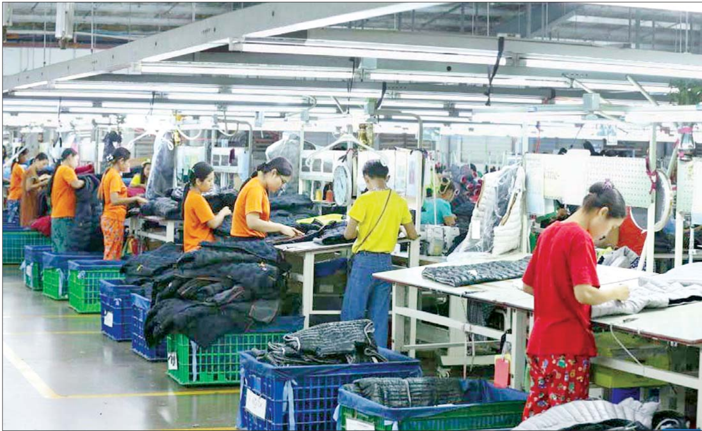
ရန်ကုန်တိုင်းဒေသကြီးအတွင်း စက်မှုဇုန်များရှိ အထည်ချုပ်စက်ရုံလုပ်ငန်းခွင်တစ်ခုကို တွေ့ရစဉ်။