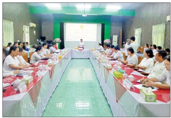
ရယူကာ အသင်းသားများအား အကျိုးခံစားခွင့် စုစုပေါင်းငွေကျပ် ၁၈၆၃၁၆၇ ဒသမ ၆၈ ကျပ်အား ပေးအပ်ခဲ့ကြောင်း သိရသည်။ မြို့နယ်(ပြန်/ဆက်)

ရန်ကုန် ဇူလိုင် ၃၀ ရန်ကုန်တိုင်းဒေသကြီး အလုံမြို့နယ်ရှိ စာရင်းစစ်ချုပ်ရုံး ငွေစုငွေချေးသမဝါယမအသင်းလီမိတက်၏ ၂၀၂၃-၂၀၂၄ ဘဏ္ဍာ နှစ် နှစ်ပတ်လည်အရပ်ရပ်ဆိုင်ရာအစည်းအဝေးကို ဇူလိုင် ၃၀ ရက် နံနက် ၁၀ နာရီက တိုင်းဒေသကြီး စာရင်းစစ်ချုပ်ရုံး မြပန်း အိုင်ခန်းမ၌ ကျင်းပသည်။