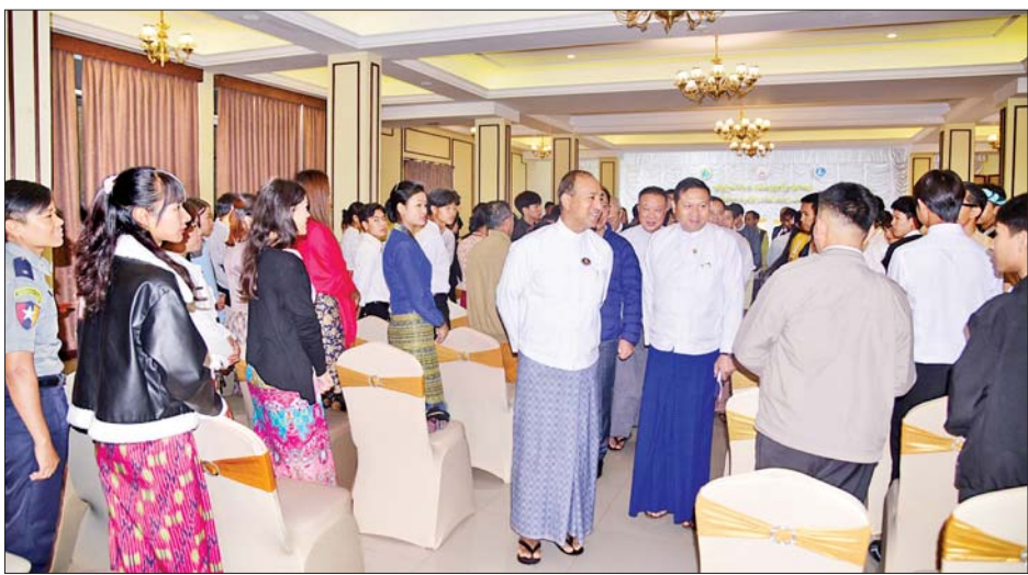
သား၊ သင်တန်းသူများကို ပြည်နယ်တရားလွှတ်တော် တရားသူကြီးချုပ်၊ ပြည်နယ်စီးပွားရေးရာဝန်ကြီးတို့ ကလည်းကောင်း၊ သင်တန်းနည်းပြများအား ပြည်နယ်သယံဇာတရေးရာဝန်ကြီးက ဂုဏ်ပြု လက်မှတ်နှင့် ထောက်ပံ့ငွေများကိုလည်းကောင်း၊ သင်တန်းဆင်း လက်မှတ်များကို ပြည်နယ်လူမှုရေးရာဝန်ကြီးကလည်းကောင်း၊ ပေးအပ်ချီးမြှင့်ခဲ့ကြောင်း သိရသည်။ (ပြန်/ဆက်)

၏ ဟိုတယ်ဝန်ဆောင်မှုကဏ္ဍတွင် ဝန်ထမ်းစုစုပေါင်း ၄၅၀၉ ဦးရှိသည့်အနက် ၂၂၀၄ ဦးသည် သင်တန်းဆိုင်ရာ သင်တန်းများကို တက်ရောက်ပြီးဖြစ်ကြောင်း တွေ့ရှိရသည့်အတွက် ယေဘုယျအားဖြင့် ၅၀ ရာခိုင်နှုန်းခန့် သင်တန်းတက်ရောက်ပြီးဖြစ်ပါကြောင်း ပြောကြားသည်။ ဆက်လက်၍ သင်တန်းဆင်းထူးချွန်ဆုများရရှိသည့် ဧည့်ကြိုဝန်ဆောင်မှု ဘာသာရပ်၊ အိပ်ခန်းဆောင်ထိန်းသိမ်းရေးဝန်ဆောင်မှု ဘာသာရပ်၊ အစားအစာနှင့် အဖျော်ယမကာဝန်ဆောင်မှုဘာသာရပ်တွင် ပထမဆုရရှိသည့် သင်တန်းသား၊ သင်တန်းသူများကို ရှမ်းပြည်နယ်ဝန်ကြီးချုပ်က ဆုများချီးမြှင့်ပေးသည်။ ထို့နောက် ဒုတိယ၊ တတိယဆုရရှိသည့် သင်တန်း