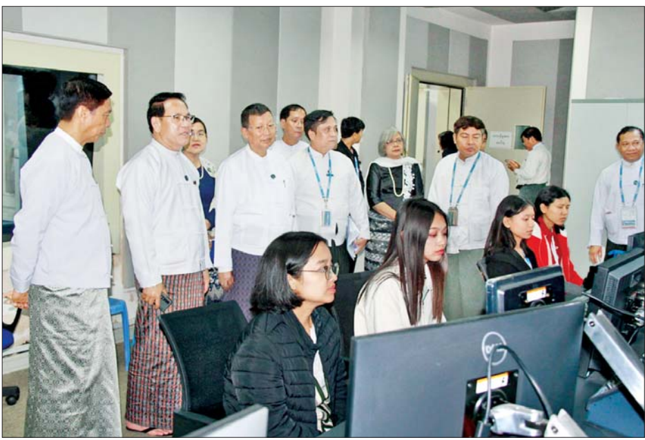
ပြည်ထောင်စုဝန်ကြီး ဦးမောင်မောင်အုန်း၊ ဦးတင်ဦးလွင်နှင့် ဒေါက်တာစိုးဝင်းတို့ နေပြည်တော် (တပ်ကုန်းမြို့)ရှိ မြန်မာ့အသံနှင့်ရုပ်မြင်သံကြားတွင် လုပ်ငန်းဆောင်ရွက်နေမှု ကြည့်ရှုလေ့လာကြစဉ်။

နေပြည်တော် ဇူလိုင် ၃၀ ပြန်ကြားရေး ဝန်ကြီးဌာန ပြည်ထောင်စုဝန်ကြီး ဦးမောင်မောင်အုန်း၊ သာသနာရေးနှင့် ယဉ်ကျေးမှု ဝန်ကြီးဌာန ပြည်ထောင်စုဝန်ကြီး ဦးတင်ဦးလွင်၊ လူမှုဝန်ထမ်း၊ ကယ်ဆယ်ရေးနှင့် ပြန်လည်နေရာချထားရေး ဝန်ကြီးဌာန ပြည်ထောင်စုဝန်ကြီး ဒေါက်တာစိုးဝင်းတို့သည် ယနေ့မွန်းလွဲပိုင်းက နေပြည်တော် တပ်ကုန်းမြို့ရှိ မြန်မာ့အသံနှင့် ရုပ်မြင်သံကြားတွင် လူဦးရေနှင့် အိမ်အကြောင်း အရာ သန်းခေါင်စာရင်းကောက်ယူရေးဆိုင်ရာ ရေဒီယိုဉာဏ်စမ်းပဟေဠိပြိုင်ပွဲ ပွဲစဉ် (၅) ယှဉ်ပြိုင်မှုနှင့် ချစ်စရာအရွယ်ကစားကြမယ် ကလေးအစီအစဉ် ယှဉ်ပြိုင်မှု ရိုက်ကူးရေးဆောင်ရွက်နေမှုများကို ကြည့်ရှုအားပေးကြသည်။ ကြည့်ရှုလေ့လာ ဦးစွာ ပြည်ထောင်စုဝန်ကြီးများနှင့်အဖွဲ့သည် မြန်မာ့အသံနှင့် ရုပ်မြင်သံကြားရှိ Convergence News Room, MRTV HD၊ MRTV News သတင်းထုတ်လွှင့်ခန်းများနှင့် သတင်း Studio များတွင် လုပ်ငန်းဆောင်ရွက်နေမှုများအား လိုက်လံကြည့်ရှု လေ့လာကြပြီး ဝန်ထမ်းများအား ရင်းရင်းနှီးနှီး တွေ့ဆုံနှုတ်ဆက် အားပေးကြသည်။ ထိုသို့ လှည့်လည်ကြည့်ရှုစဉ် ၂၀၁၉ ခုနှစ်တွင် လှုပ်ခတ်ခဲ့သည့် သပိတ်ကျင်း မြေငလျင်ဒဏ်ကြောင့် မြန်မာ့အသံနှင့်ရုပ်မြင်