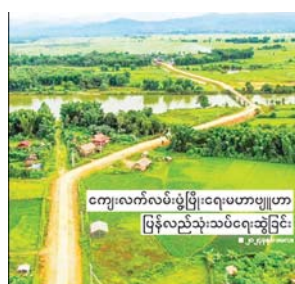
ဆောင်းပါး စာမျက်နှာ » ၁၁

ကျေးလက်လမ်းများ ရာသီမရွေး ကောင်းမွန်ရေးမှသည် စီးပွားရေး ဖွံ့ဖြိုးရေးဆီသို့