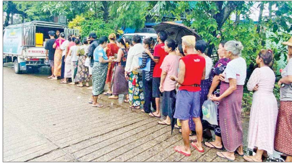
မြန်မာနိုင်ငံဆီကုန်သည်နှင့်ဆီလုပ်ငန်းရှင်များအသင်းအစီအစဉ်အရ ပြည်သူများထံသို့ ကားများဖြင့် ဆီရောင်းချပေးစဉ်။

ရန်ကုန် ဇူလိုင် ၃၀ အိမ်ထောင်စုတစ်စုလျှင် တစ်လအတွက်တစ်ကြိမ် စားအုန်းဆီ နှစ်ပိဿာနှုန်းဖြင့် ဖြန့်ဖြူးရောင်းချရန် စီစဉ်ဆောင်ရွက်ထားကြောင်း မြန်မာနိုင်ငံဆီကုန် သည်နှင့်ဆီလုပ်ငန်းရှင်များအသင်းမှ သိရသည်။ ဖြန့်ဖြူးပေးလျက်ရှိ ရန်ကုန်တိုင်းဒေသကြီးအတွင်းရှိ မြို့နယ်(၄၄) မြို့နယ်၌ စားအုန်းဆီတင်သွင်းသို့လှောင်ဖြန့်ဖြူးခြင်း လုပ်ငန်းကြီးကြပ်ရေးကော်မတီ၏ ကြီးကြပ်မှု အောက်တွင် စားအုန်းဆီတင်သွင်းသော ကုမ္ပဏီများက လက်လီ/လက်ကား အရောင်းဆိုင်များမှ တစ်ဆင့် ပြည်သူများသို့ နေ့စဉ်၊ လစဉ် စားအုန်းဆီ များ ဖြန့်ဖြူးပေးလျက်ရှိသည်။ ထိုသို့ဖြန့်ဖြူးလျက်ရှိသော်လည်း အရောင်းဆိုင်များသို့ သွားရောက်ဝယ်ယူရန် အခက်အခဲရှိသော အိမ်ထောင်စုများအနေဖြင့် စားအုန်းဆီများကို မိသားစုတစ်စု တစ်လစာဝယ်ယူနိုင်ရန်၊ လျင်မြန် လွယ်ကူစွာဖြင့် အိမ်အရောက် ဝယ်ယူနိုင်စေရန် ရည်ရွယ်ပြီး အိမ်ထောင်စုတစ်စုလျှင် တစ်လအတွက်