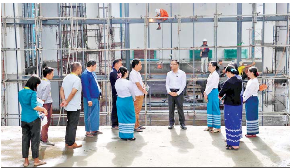
အချိန်မီပြီးစီးရေး ဆောင်ရွက်ရန် မှာကြားသည်။ ယင်းနောက် ဒုတိယဝန်ကြီးသည် လှိုင်မြို့နယ်ရှိ သတင်းအချက်အလက် နည်းပညာတက္ကသိုလ်သို့ ရောက်ရှိပြီး ကျောင်းသားကျောင်းသူများနှင့် ရင်းရင်းနှီးနှီးတွေ့ဆုံကာ နောက်ဆုံးပေါ် Digital Transformation ဆိုင်ရာ IT နည်းပညာ အရွေ့နှုန်းနှင့်အတူ အစီလိုက်ပါနိုင်ရန်နှင့် ပြည်သူများ၏ လူမှုစီးပွားဘဝဖွံ့ဖြိုးတိုးတက်ရေး အထောက်အကူပြု IT နည်းပညာရှင်များဖြစ်အောင် ကြိုးပမ်း ဆောင်ရွက်ကြရန် တိုက်တွန်းမှာကြား၍ တက္ကသိုလ်ပင်မဆောင် တည်ဆောက်ရေးလုပ်ငန်းခွင်အတွင်း လှည့်လည်ကြည့်ရှုစစ်ဆေးသည်။ သိပ္ပံနှင့်နည်းပညာဝန်ကြီးဌာန သတင်းစဉ်

နေပြည်တော် ဇူလိုင် ၃၀ သိပ္ပံနှင့်နည်းပညာ ဝန်ကြီးဌာန ဒုတိယဝန်ကြီး ဒေါက်တာအောင်ဇေယျသည် ယမန်နေ့ မွန်းလွဲပိုင်းက လှိုင်သာယာမြို့နယ် ရန်ကုန်အနောက်ပိုင်း နည်းပညာတက္ကသိုလ်သို့ သွားရောက်ကြည့်ရှုစစ်ဆေးပြီး ကျောင်းသား ကျောင်းသူများနှင့် ရင်းရင်းနှီးနှီးတွေ့ဆုံကာ လိုအပ်ချက်များ ဖြည့်ဆည်းဆောင်ရွက်ပေး၍ နိုင်ငံဖွံ့ဖြိုးရေး တည်ဆောက်ရာတွင် အမှန်တကယ်အားထားရသည့် ပြည်သူ့အကျိုးသယံပိုးနိုင်သော၊ ဗလငါးတန်နှင့်ပြည့်စုံသော အင်ဂျင်နီယာများဖြစ်အောင် ကြိုးပမ်းဆောင်ရွက်ကြရန် တိုက်တွန်းမှာကြားသည်။ လှည့်လည်ကြည့်ရှု ထို့နောက် ဒုတိယဝန်ကြီးသည် တက္ကသိုလ်ပင်မဆောင် တည်ဆောက်ရေးလုပ်ငန်းခွင် အတွင်း လှည့်လည်ကြည့်ရှု စစ်ဆေးပြီး အရည်အသွေး ပြည့်မီရေးနှင့်