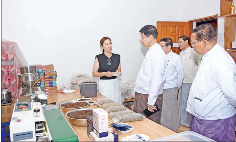
ကော်ဖီသည် တိုင်းပြည်အတွက်၊ ဒေသအတွက် ကော်ဖီသည် နိုင်ငံတကာဈေးကွက်ဝင် နာမည်ကောင်းအကျိုးရှိသည့်လုပ်ငန်းတစ်ခုဖြစ်ကြောင်း၊ မြန်မာ့ရရှိနေပြီဖြစ်ကြောင်း၊ ကော်ဖီကဏ္ဍနှင့် ကော်ဖီတန်ဖိုး